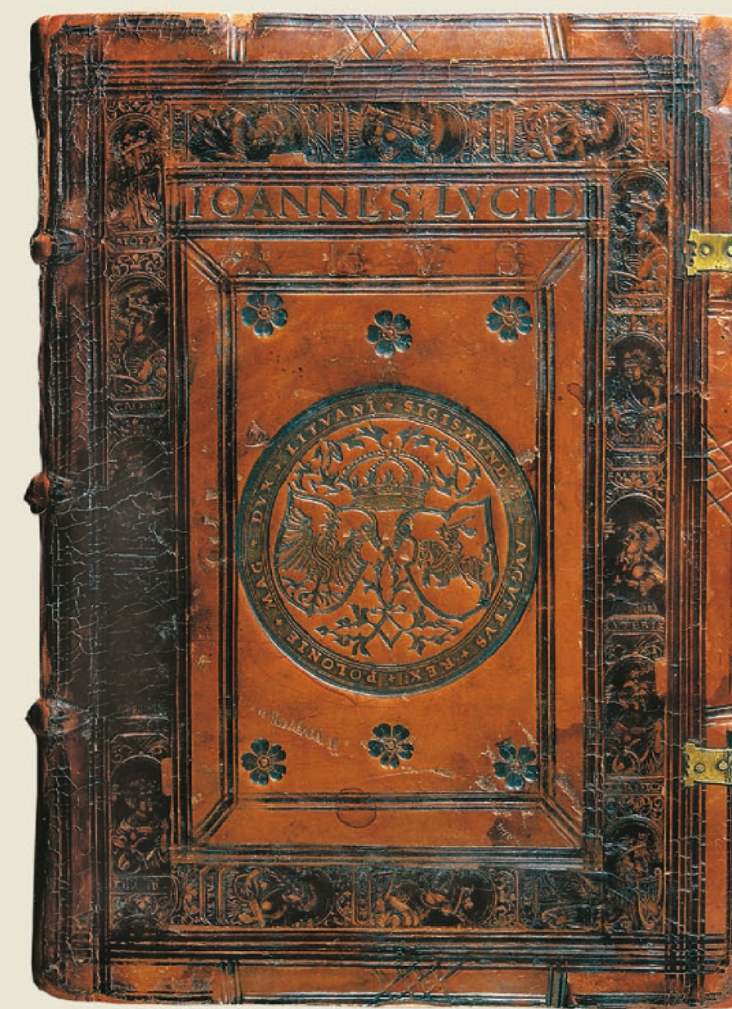
Žygimanto Augusto bibliotekos, buvusios Valdovų rūmuose, knyga, Vilnius, 1557 m.