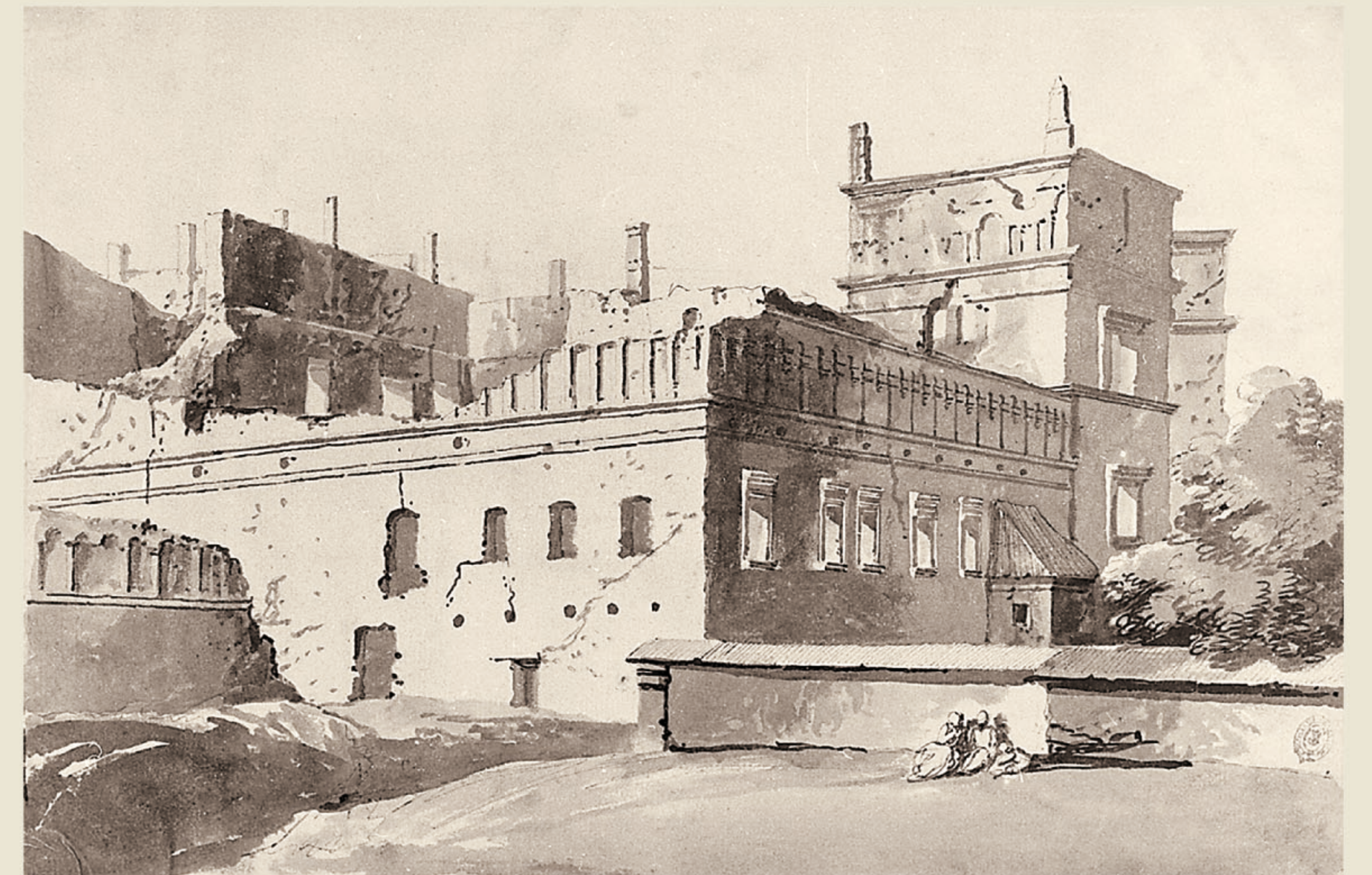
Valdovų rūmų šiaurės vakarų korpusas – vadinamieji Žygimanto Augusto Naujieji rūmai. Pranciškaus Smuglevičiaus sepija, apie 1797 m.