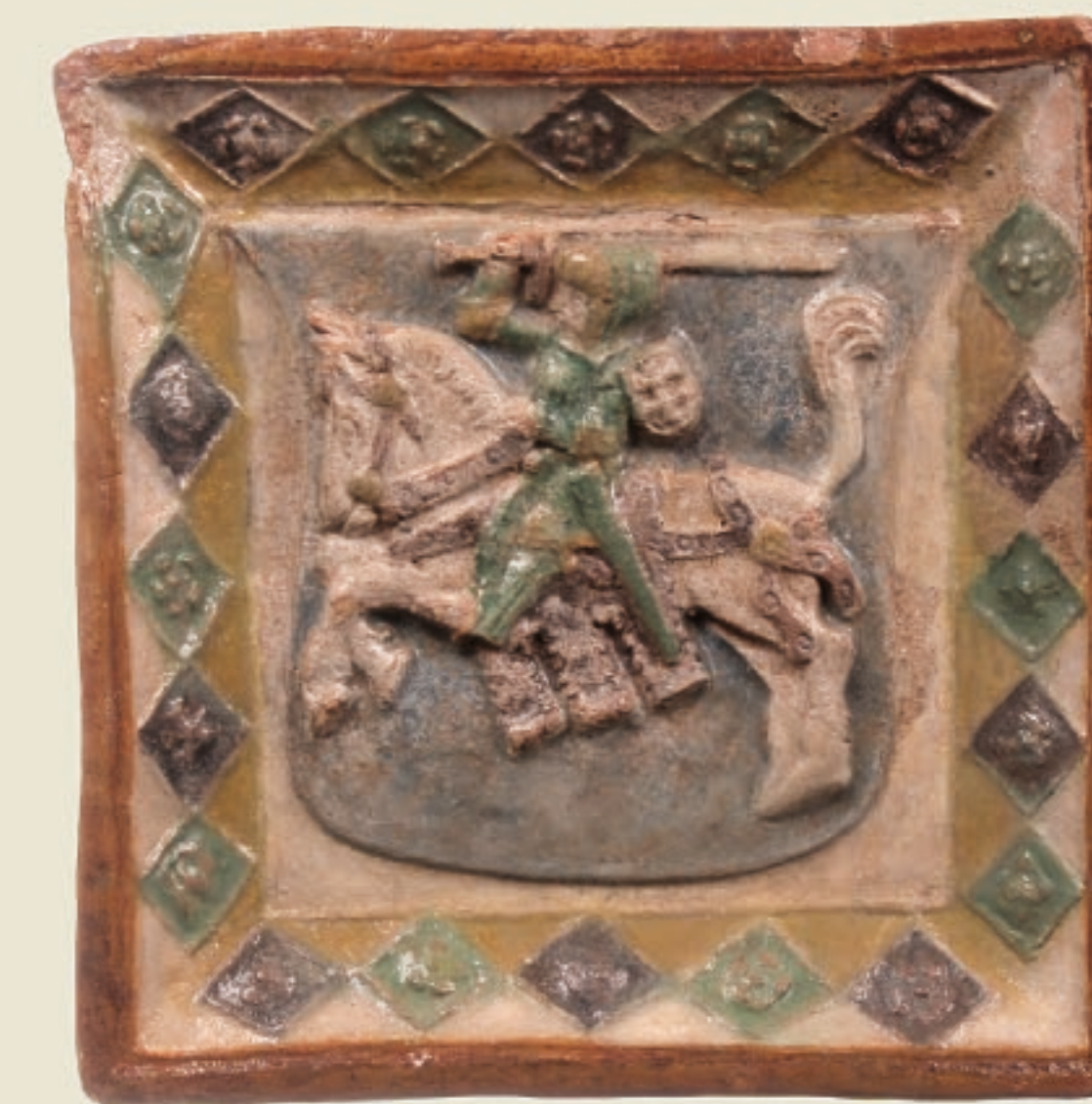
XVI a. herbinis koklis su LDK herbu – Vyčiu. PTC