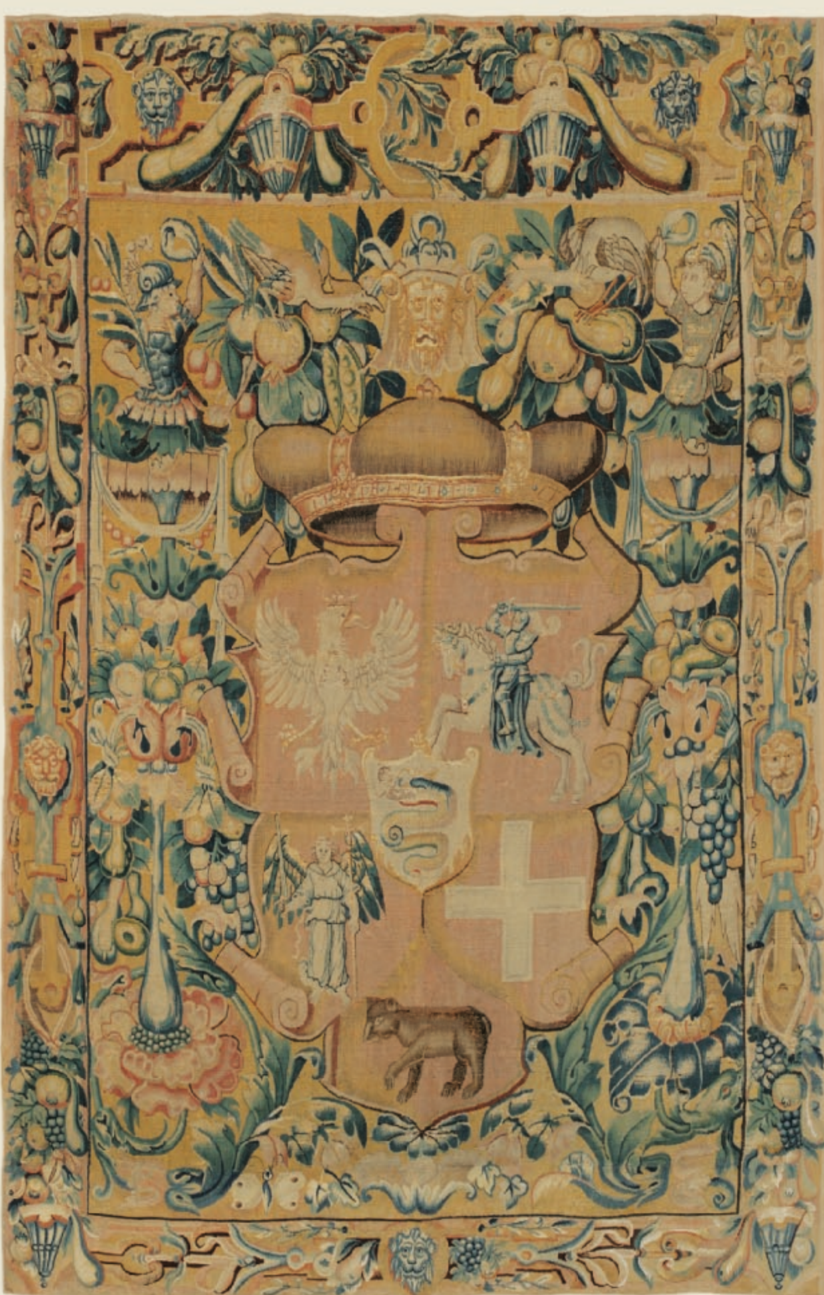
Gobelenas su Lietuvos Didžiosios Kunigaikštystės didžiuoju herbu, Flandrija, XVI a. LDK VR