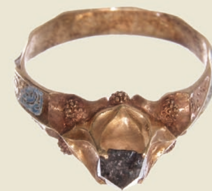
XVI a. auksinis, emalo ir filigrano technika puoštas žiedas su deimanto akute. PTC