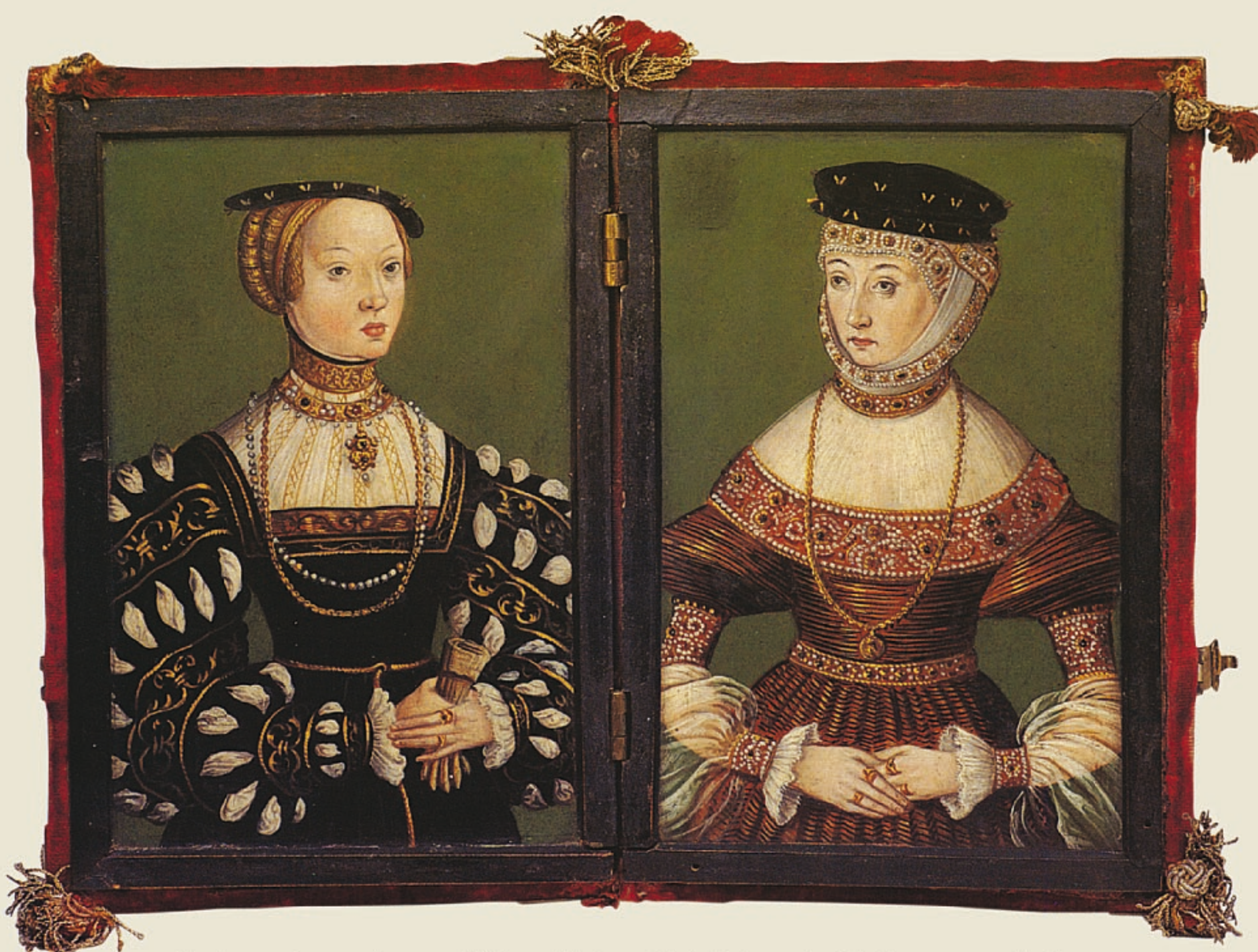
Žygimanto Augusto žmoną – Elžbietos Habsburgaitės ir Barbaros Radvilaitės – portretų diptikas, Vilnius, 1543–1551 m.