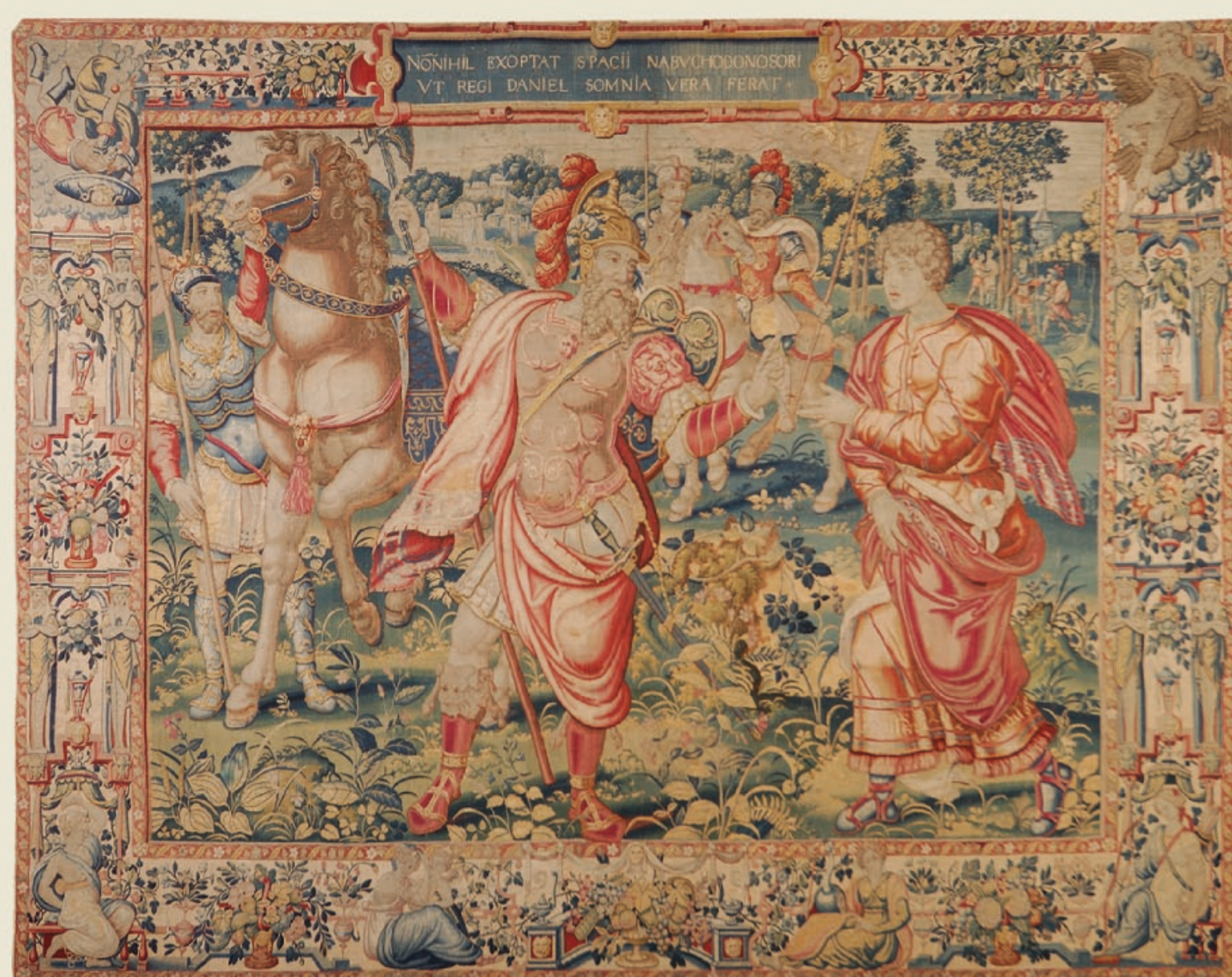
Gobelenas „Danielius sutinka Ariochą“, Flandrija, Briuselis, 1550–1560 m. LDK VR