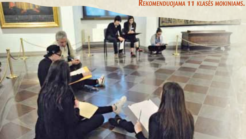
Valdovų rūmų muziejaus Renesansinė audiencijų menė, arba Žemutinė reprezentacinė salė

UŽSIĖMIMO TRUKMĖ – 1 VAL. REKOMENDUOJAMA 11 KLASĖS MOKINIAMS.