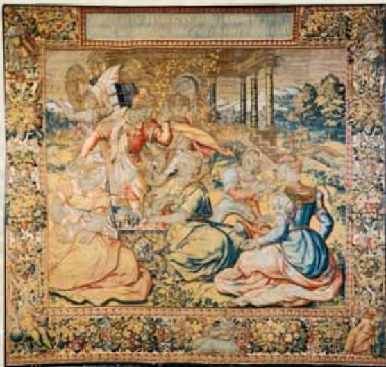
Gobelenas „Achilas ir Likmedo dukterys“, iš serijos „Odisejo istorija“, Bruuselis, Flandrija, apie 1570