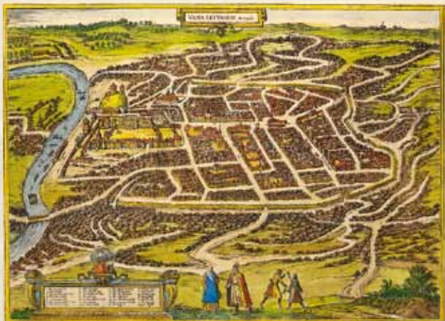
Vilniaus vaizdas, apie 1545. Iš Georgo Brauno (Georg Braun) atlaso Civitates orbis terrarum , raižytojas Fransas Hogenbergas (Frans Hogenberg), Kelnas, 1581