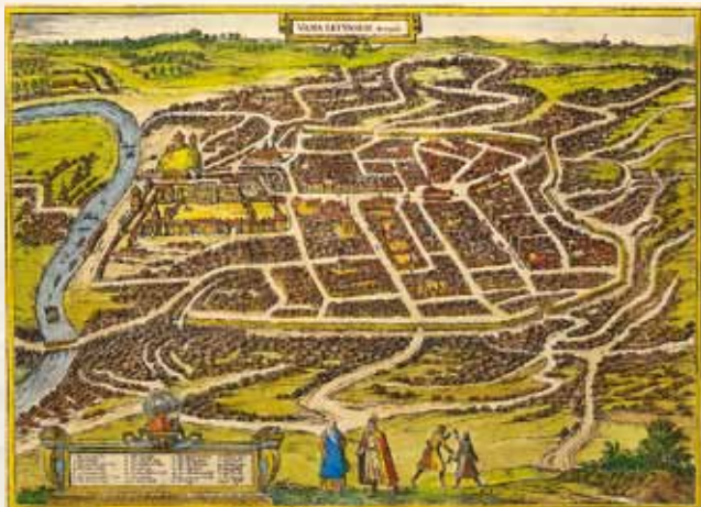
Vilniaus vaizdas, apie 1545. Iš Georgo Brauno (Georg Braun) atlaso Civitates orbis terrarum , raižytojas Fransas Hogenbergas (Frans Hogenberg), Kelnas, 1581