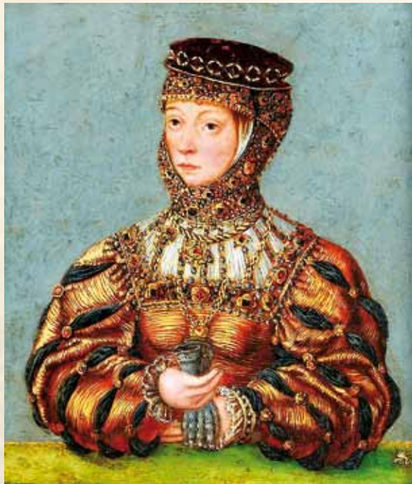
Barboros Radvilaitės (1522/1523–1551) portretas, dailininkas Lukas Kranachas Jaunesnysis (Lucas Cranach der Jüngere)

REKOMENDUOJAMA ŠEIMOMS SU VYRESNIO AMŽIAUS VAIKAIS, VYRESNIŲ KLASIŲ MOKINIAMS IR VISIEMS, KURIE DOMISI ISTORIJA.