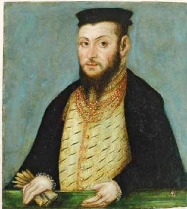
Lietuvos didžiojo kunigaikščio ir Lenkijos karaliaus Žygimanto Augusto (1544/1548–1572) portretas, dailininkas Lukas Kranachas Jaunesnysis (Lucas Cranach der Jüngere)

REKOMENDUOJAMA ŠEIMOMS SU MOKYKLINIO AMŽIAUS VAIKAIS.